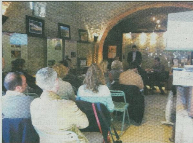
Les vignerons réunis dans l'enceinte de la vinothèque de Trets.

Sur le plan économique, l'optimisme reste de rigueur à la Vino-