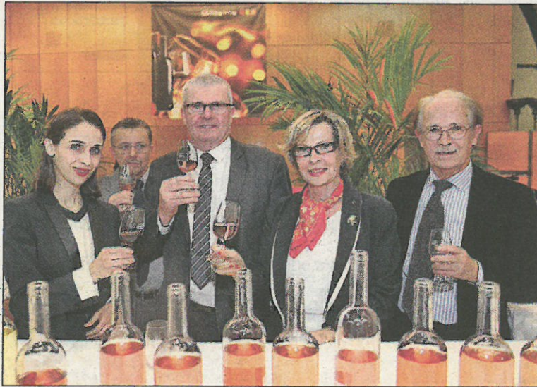
Millésime 2014 (GG13)